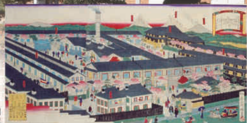
錦絵「上州富岡製糸場」 富岡市立美術館蔵