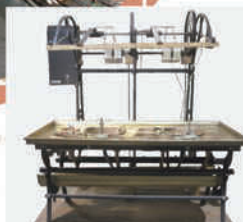
フランス式繰糸器復元機実演中 ※実演時間はHPをご確認ください。