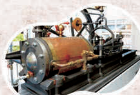
プリュナエンジン 復元機展示中