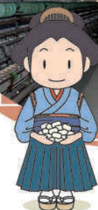
富岡市 イメージキャラクター お富ちゃん