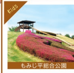
もみじ平総合公園

敷地内には県立自然史博物館や市立美術博物館があり、秋には真っ赤なもみじを楽しめる総合公園です。お子様が遊べる遊具もあるので、親子連れの方、散策やジョギングなどをする方にぎわっています。天気のよい日には、赤城、榛名、妙義の山が見られることも。