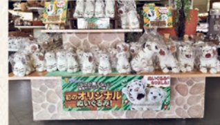
レストラン サバンナ