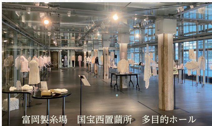
富岡製糸場 国宝西置繭所 多目的ホール