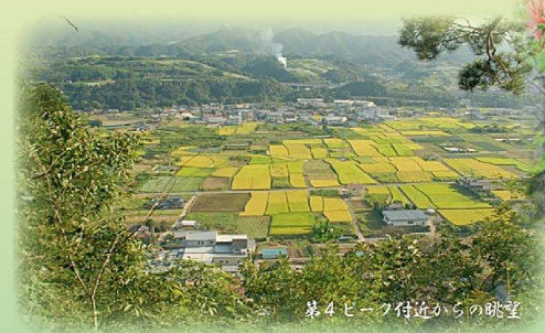
第4ピーク付近からの眺望