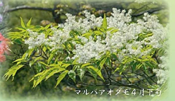
マルバオダモ 4月下旬