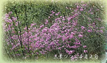
三葉ツツジ 4月上旬

神成山は里山ですが全コース尾根歩きの手軽なコースです。 春夏秋冬いつでも自然満喫の散策が楽しめます。