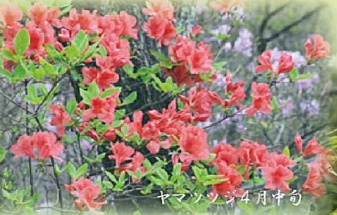
ヤマツツジ 4月中旬