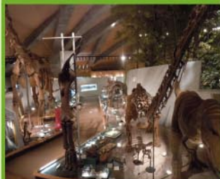
県立自然史博物館