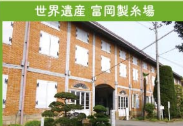
世界遺産 富岡製糸場