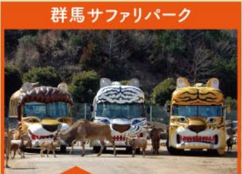
群馬サファリパーク